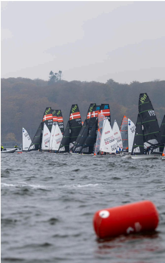
Uge 42-lejr i Aarhus.