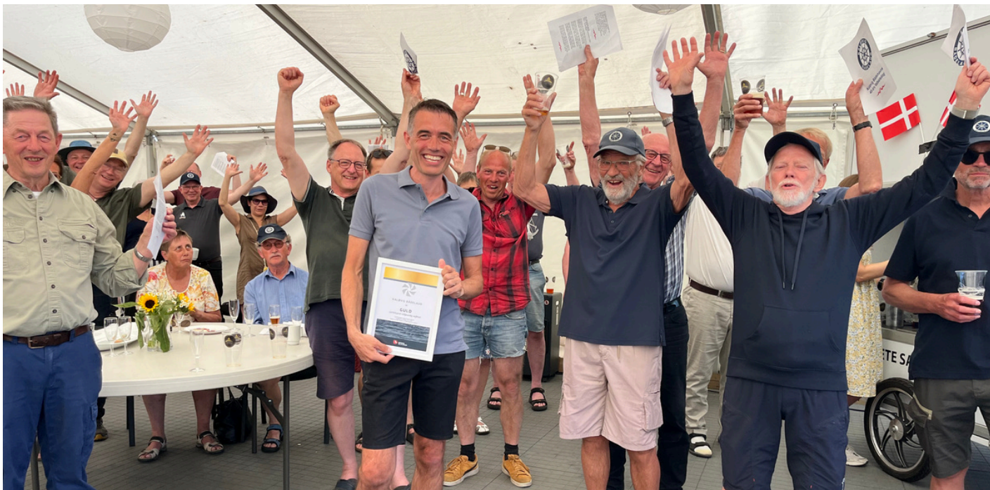
Foto: Kaløvig Bådelaug modtager Dansk Sejlunions 'Miljøvenlig Sejlklub' Guld-certificering.