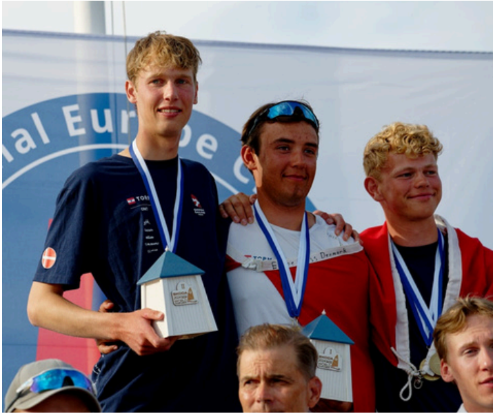
Rent dansk podium ved Europe VM