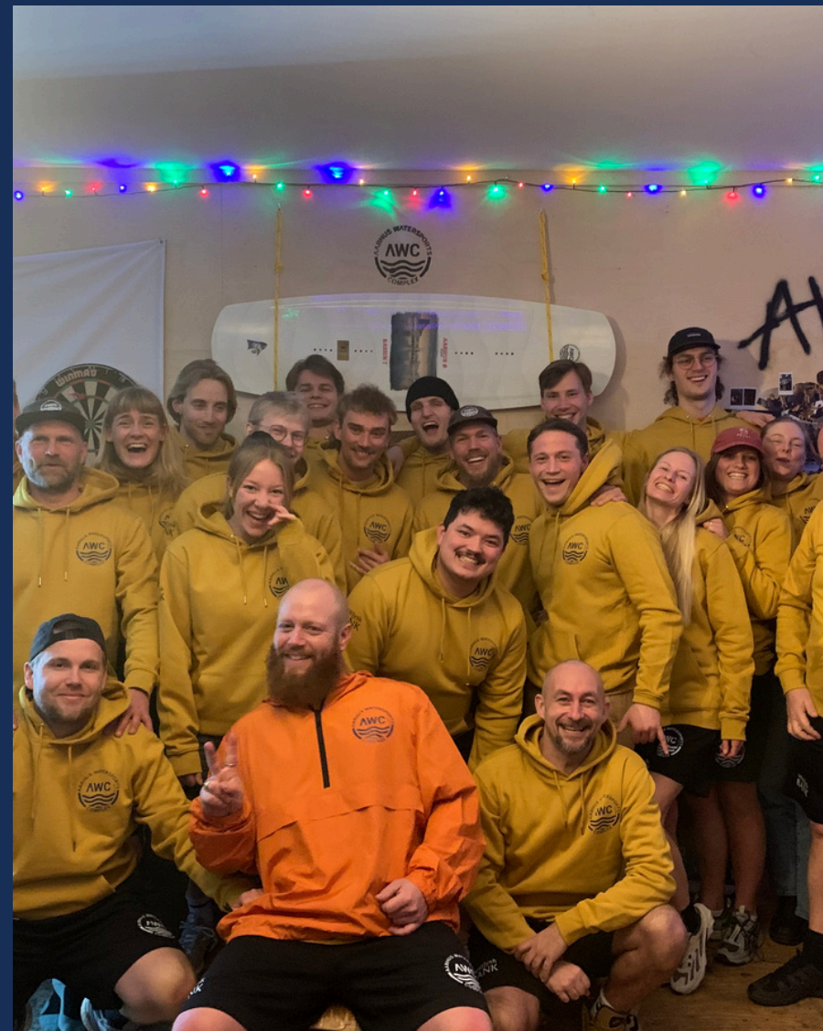
Fokus fra frivillige til medlemmet