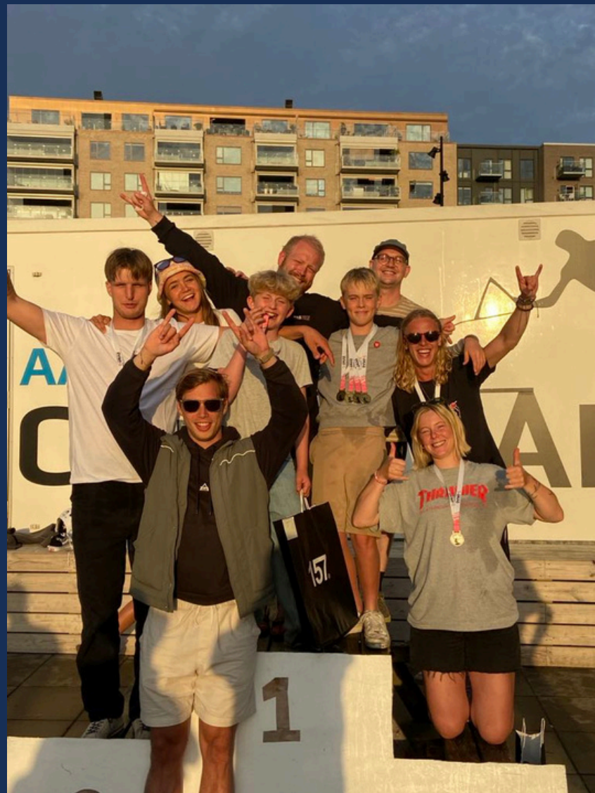
Frivillige udskiftet med ansatte