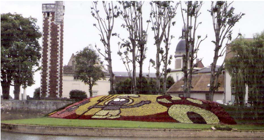
Chalon-sur-Saône – SW spidsen af Île St.Martin.Årets blomsterdekoration. Flodens hovedløb er til venstre. Det gamle løb til højre fører ind til en herlig pontonhavn, hvor vi har været mange gange.

Chalon-sur-Saône nogle få timers sejlads længere fremme hører også til vores yndlingsbyer, så der blev anledning til en lang bytur, gensyn med St. Vincent domkirken og nogle væsentlige indkøb, som skulle sendes med posten derfra. I havnen mødte vi en ung nordmand, som gerne ville vide alt om, hvordan han skulle komme hjem med sin båd, han var